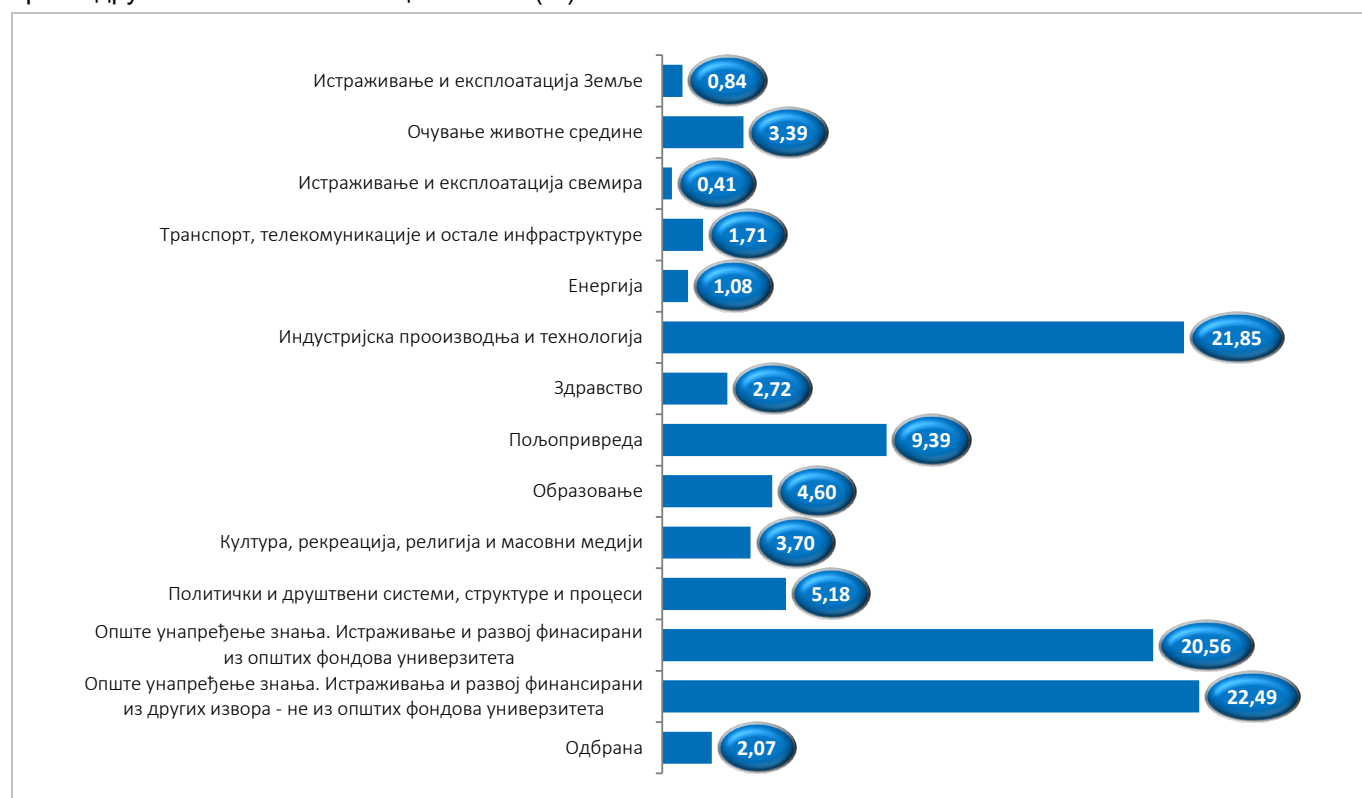
Графикон 4. Удео планираних буџетских средстава за ИР (усвојени буџет пре ребаланса) за 2024. годину, према друштвено-економским циљевима (%)