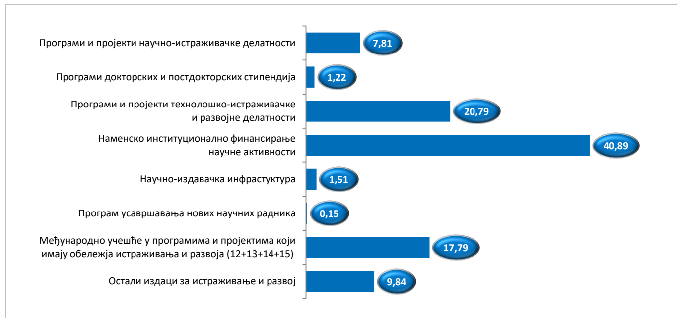
Графикон 2. Удео буџетских средстава за ИР у 2023. години, према програмима (%)