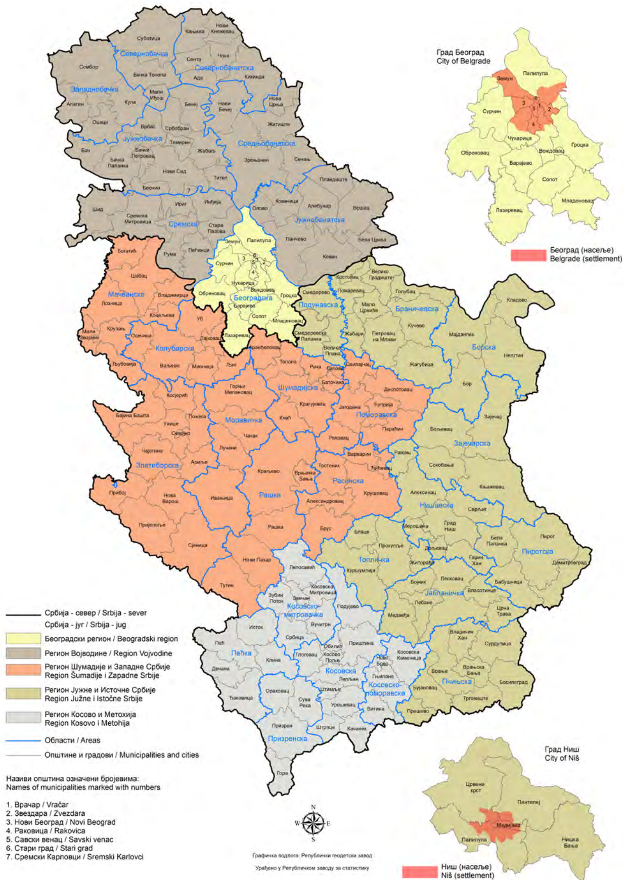
Map 1. Municipalities and cities of the Republic of Serbia by areas and regions