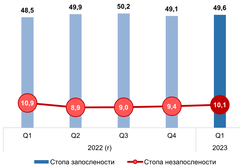
Граф. 1. Стопе запослености/незапослености, популација узраста 15 и више година, 2022–2023. (%)

У првом кварталу 2023. године број запослених износио је 2 835 900, а број незапослених 317 800. Стопа запослености за дати период износи 49,6%, а стопа незапослености 10,1%.