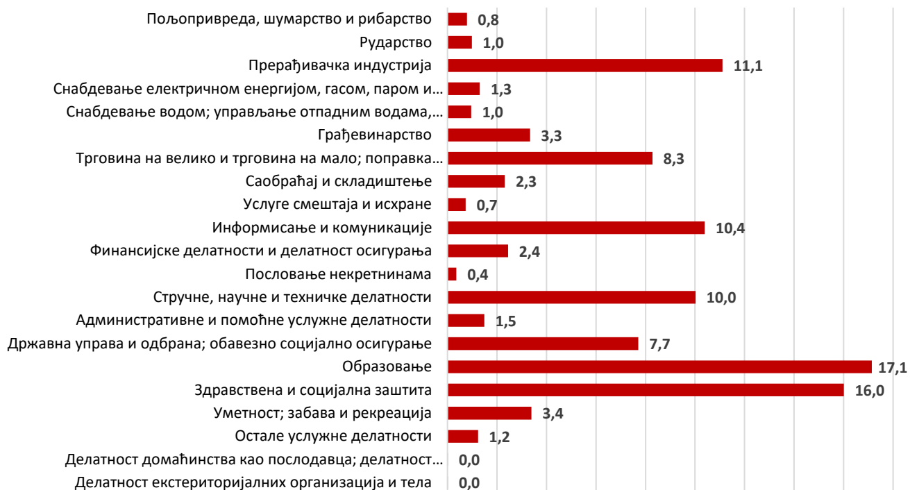
Граф. 3. Лица старости 15–74 год., запослена у областима науке и технологије, према секторима делатности у којима раде, %

Највеће је учешће лица која раде као: истраживачи, инжењери, стручни сарадници или техничари у сектору делатности Образовање (17,1%), затим Здравствена и социјална заштита (16%), Прерађивачка индустрија (11,1%) и Стручне, научне, иновационе и технолошке делатности (10%).