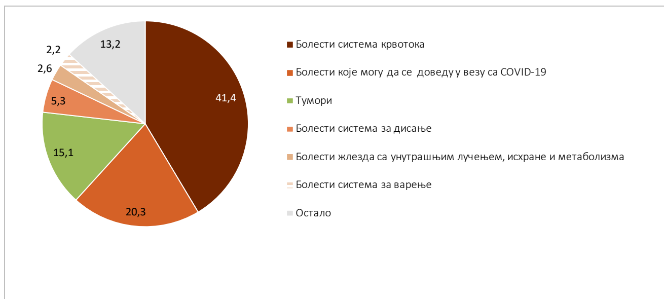
Графикон 3. Умрли према Међународној статистичкој класификацији болести и сродних здравствених проблема (МКБ-10) 1

Водећи узрок смрти код оба пола су болести система крвотока. Од овог узрока смрти, умрло је 56 610 лица (41,4% од укупног броја умрлих лица), и то: 26 306 мушкараца и 30 304 жене. На другом месту су болести које могу да се доведу у везу са COVID-19 од којих је умрло 27 742 лица (20,3% од укупног броја умрлих), односно 15 218 мушкараца и 12 524 жене, док су на трећем месту тумори, од којих је у 2021. години умрло 20 609 лица (15,1% од укупног броја умрлих), односно 11 313 мушкараца и 9 296 жена.