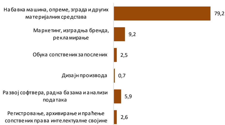
Граф. 3. Структура издатака пословних субјеката, 2020. (%)

Учешће трошкова за набавку машина и опреме је око 80% и представља највећи удео укупних издатака за иновативне активности пословних субјеката, док је око 20% средстава уложено у све остале активности.