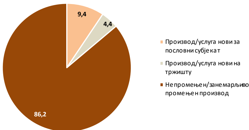
Граф. 2. Структура прихода иноватора (%)

У структури прихода пословних субјеката иноватора доминира учешће прихода од продаје непромењених или занемарљиво мало промењених производа и износи преко 86%. Учешће од продаје производа/услуга који су нови за пословни субјекат и учешће од продаје производа/услуга који су нови на тржишту збирно износи око 14%.