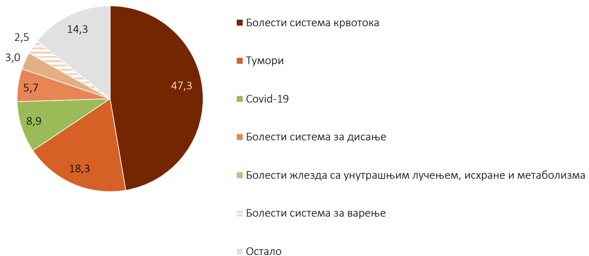
Графикон 3. Умрли према Међународној статистичкој класификацији болести и сродних здравствених проблема (МКБ-10) 1

Водећи узрок смрти код оба пола биле су болести система крвотока. Од овог узрока смрти, умрло је 55 305 лица (47,3% од укупног броја умрлих лица), и то: 25 617 мушкараца и 29 688 жена. Тумори су на другом месту, од којих је у 2020. години умрло 21 392 лица (18,3% од укупног броја умрлих), односно 11 977 мушкараца и 9 415 жена, док су на трећем месту болести које могу да се доведу у везу са COVID-19 (умрло 10 356 лица (8,9%), односно 6 629 мушкараца и 3 727 жена).