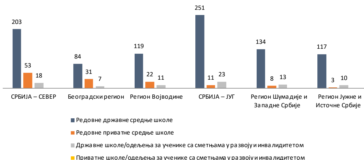
Средње школе према облику својине

Опште средње образовање – гимназију похађало је 27,1% ученика. Средње стручно образовање похађало је скоро 72,9% ученика, а најпопуларнији су били образовни профили из подручја рада „економија, право и администрација“ (12%), „електротехника“ (11,9%), „здравство и социјална заштита“ (9,6%), „машинство и обрада метала“ (8,9%) и „трговина, угоститељство и туризам“ (7,8%).