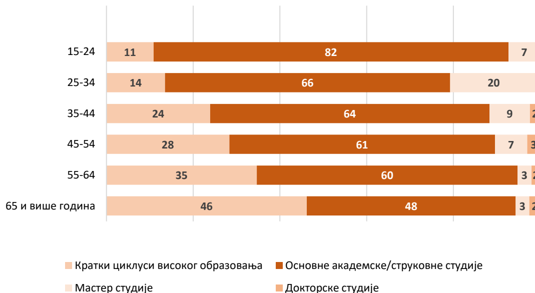
Граф. 1. Лица старости 15–74 запослена у областима науке и технологије, према старосним групама и нивоима високог образовања, %

У језгру људских ресурса највише је лица са завршеним првим степеном високог образовања (ниво ISCED 6) – 60,8%. Међу њима је највеће учешће најмлађе старосне групе (15–24) – чак 82,0%.