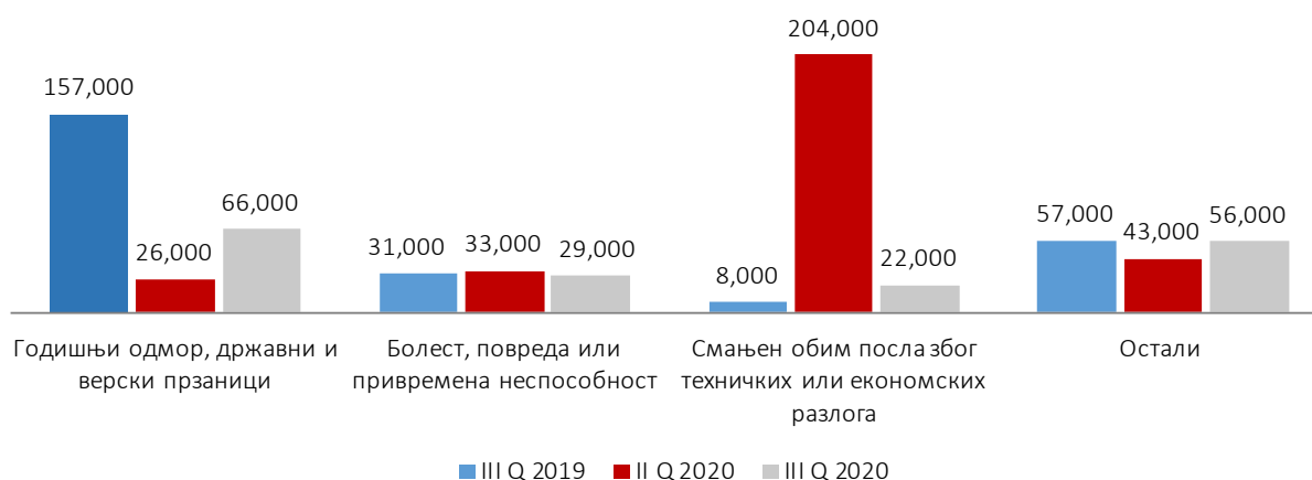
Граф. 2. Број запослених одсутних с посла према разлозима одсуства

У другом кварталу 2020. доминантан разлог одсуства с посла је био смањен обим посла због техничких или економских разлога и више од 200 000 запослених који су били одсутни с посла у другом кварталу навели су управо овај разлог. У трећем кварталу 2020. одсуство с посла због смањеног обима посла из техничких или економских разлога смањено је скоро десет пута у односу на претходни квартал. Посматрано у односу на исти период прошле године, број запослених који су били одсутни с посла због годишњег одмора, такође је значајно смањен у трећем кварталу 2020. године. Иако је у трећем кварталу сезона годишњих одмора, ове године је број запослених који су отишли на годишњи одмор за скоро 100 000 мањи него у истом периоду прошле године.