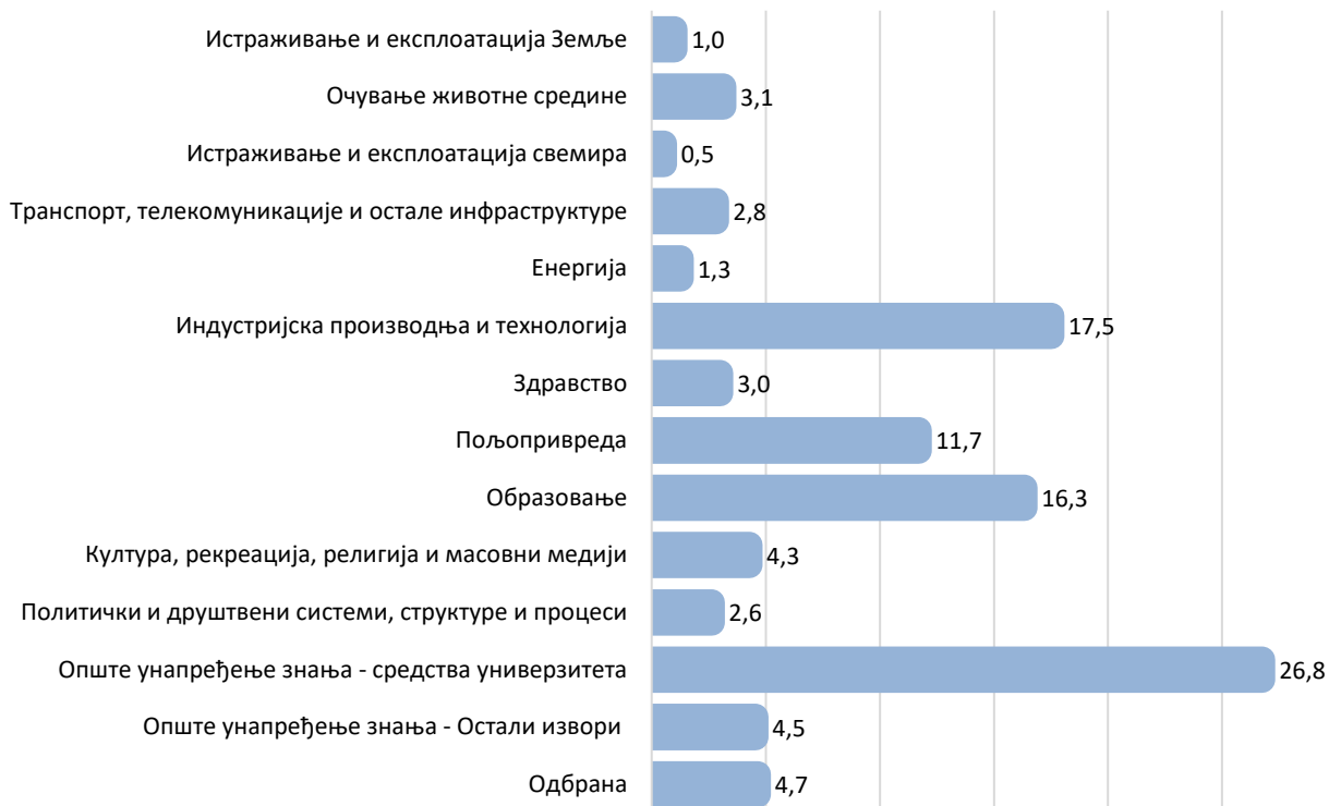
Граф. 4. Удео планираних буџетских средстава за ИР (усвојени буџет пре ребаланса), за 2020. годину према циљевима, %