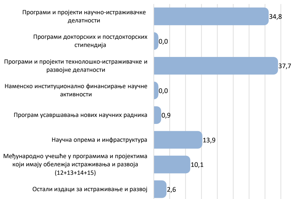
Граф. 2. Удео буџетских средстава за ИП у 2019. години према програмима, (%)