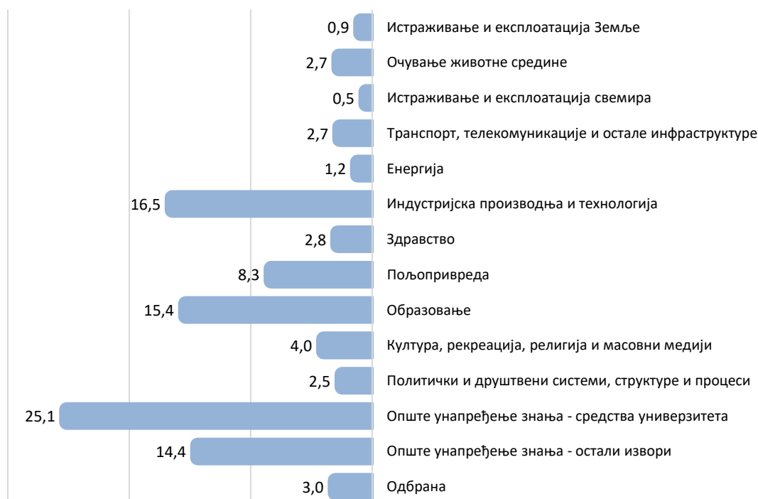
Граф. 3. Удео буџетских средстава за ИР у 2019. години према друштвено-економским циљевима (стварни издаци), %