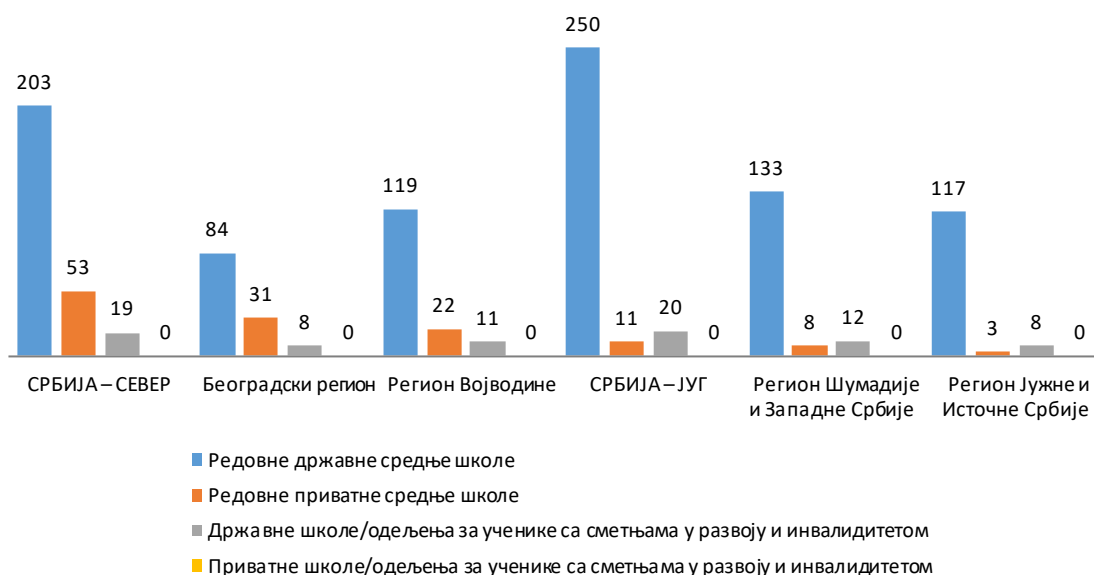
Средње школе према облику својине

Опште средње образовање – гимназију похађало је 26,7% ученика. Средње стручно образовање похађало је скоро 73,3% ученика, а најпопуларнији су били образовни профили из подручја рада „економија, право и администрација“ (12,3%), „електротехника“ (11,6%), „здравство и социјална заштита“ (9,5%), „машинство и обрада метала“ (9%) и „трговина, угоститељство и туризам“ (7,9%).