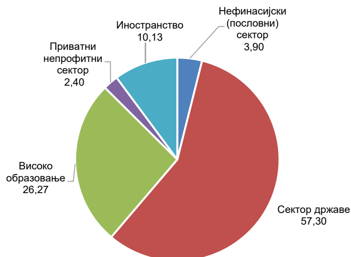
Граф. 1. Учешће сектора у укупним издацима (%)

Средства која су планирана за ИР буџетом за 2018. годину (пре ребаланса буџета) износила су 15.493.285 хиљ. РСД. Највише средстава, 33,9%, планирано је за Опште унапређење знања: ИР финансирани из општих фондова универзитета.