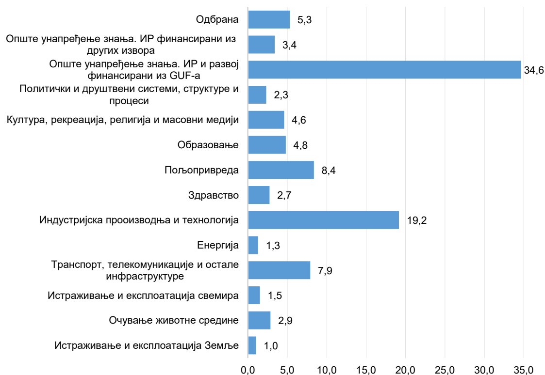
Граф. 2. Удео буџетских средстава за ИР у укупним буџетским издацима за ИР према друштвено-економским циљевима (стварни издаци), 2017. (%)