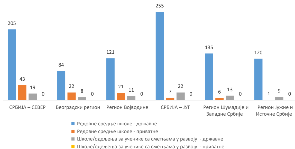
Средње школе према облику својине

Око 26% ученика похађало је опште средње образовање – гимназију. Средње стручно образовање похађало је скоро 74% ученика, а најпопуларнији су били образовни профили из подручја рада „Економија, право и администрација“ (13,3%), „Електротехника“ (10,9%), „Здравство и социјална заштита“ (9,6%), „Машинство и обрада метала“ (8,7%) и „Трговина, угоститељство и туризам“ (8,1%).