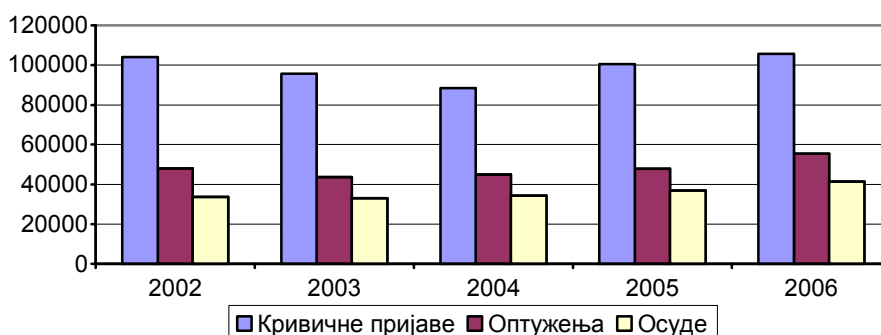
Малолетни учиниоци кривичних дела, 2002 - 2006.